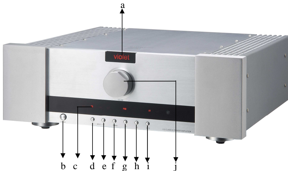
violet 3.3 遙控綜合擴大機 面板圖